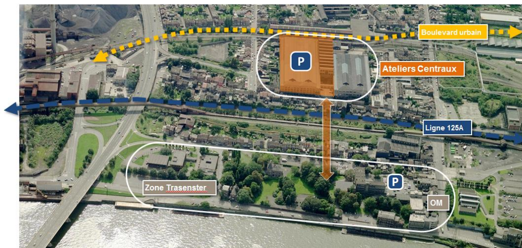
Légende photo : le site des Ateliers Centraux et le parc de Trasenster

La première phase de mutation du site prévoit la création d'un parking de 650 places dans la halle Est, l'aménagement d'une traversée piétonne dans la halle centrale et la création d'une passerelle piétonne/cycliste vers le parc de Trasenster.